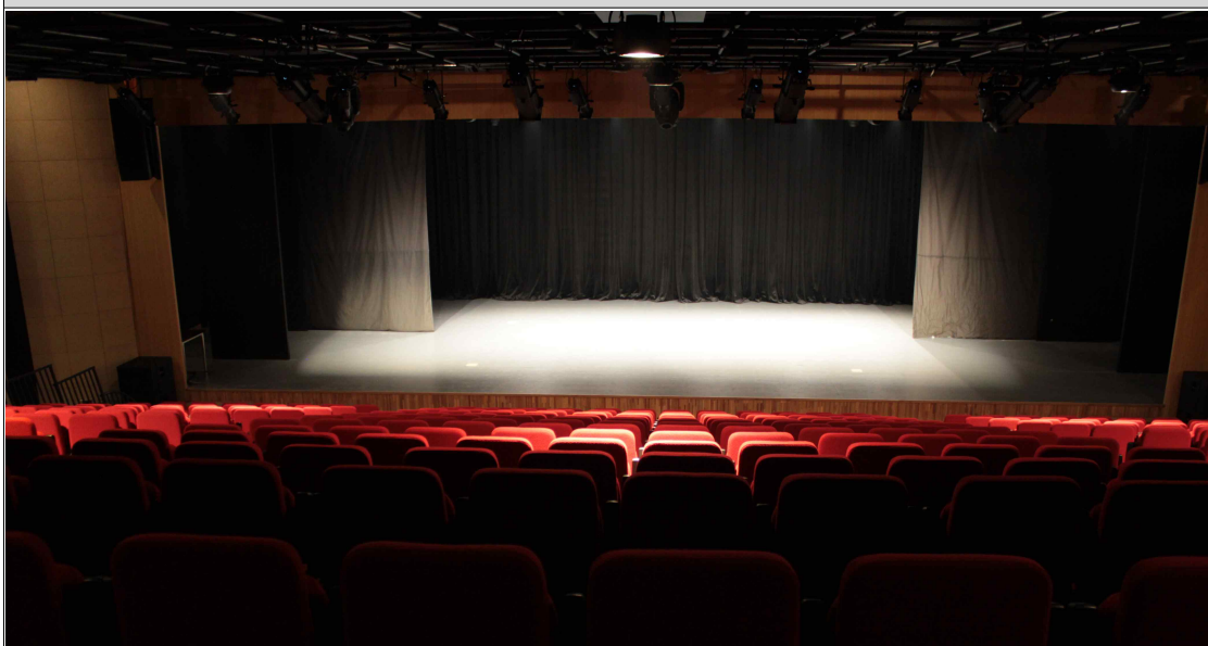
Proscenium - 상부 Grid